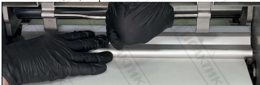
Подключите оборудование к сети и включите машину, с помощью выключателя.