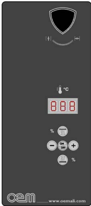
Цифровая панель управления