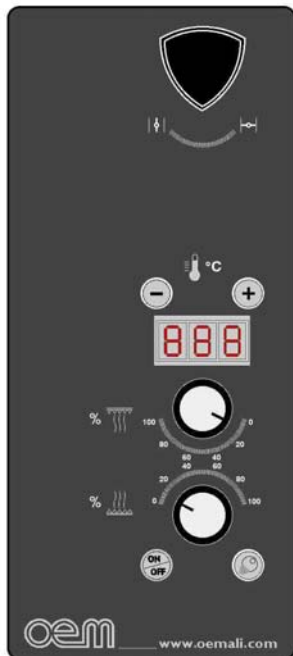
Электромеханическая панель управления