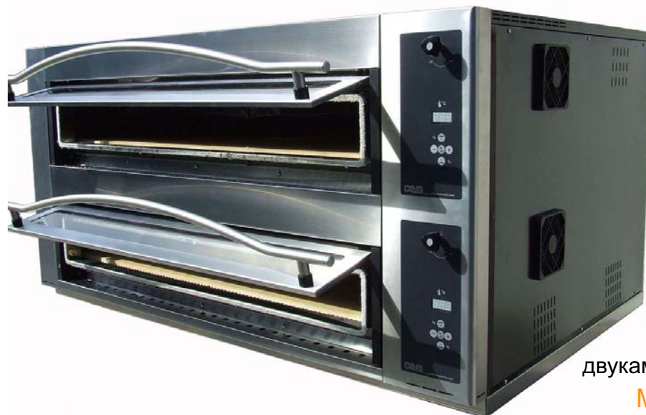
двухкамерная печь MB 12.35 LD

Компания OEM анонсировала начало поставок новой серии печей для пиццы Millennium Reverso. Новый модельный ряд соответствует по классу скандинавским печам Sveba Dahlin, Pizza-Master. Печи предназначены для использования в проектах, работающих с большой нагрузкой – это в первую очередь крупные сетевые пиццерии выпекающие пиццу широкого ассортимента.